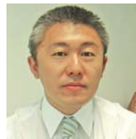
*Por Silvio Tanabe

• Disseminar mensagens virais, por meio dos comentários. Gostou desse artigo? Clique em Curtir e não só seus fãs no Facebook mas também em outras redes sociais dos quais você participa também ficarão sabendo. Esse recurso, o Facebook Connect, rapidamente copiado por outros grandes sites como o Google e Yahoo!, permite que o conteúdo de qualquer site se torne social.