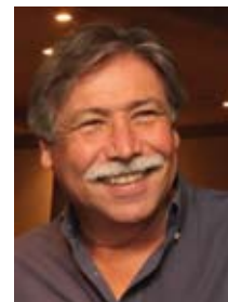
*Por Sílvio Barboza

Assim creio que devemos pontuar mudanças que sejam mais fáceis de negociar e serem entendidas pelos eleitores. Nesse sentido proponho foco apenas no sistema de voto. Minha proposta é que o Voto Distrital Misto é o mais fácil de ser negociado e que, se passar, vai ao longo do tempo renovar o quadro político e permitir avanços em todo o processo.